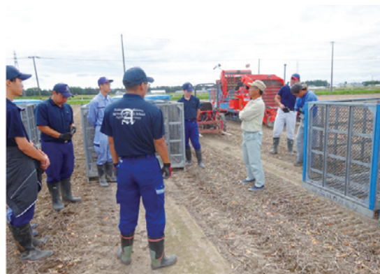
生産者を訪問して聞き込みをしたほか、共同作業も行った。

北海道岩見沢市は、日本有数のタマネギ産地のひとつだが、タマネギ農園では、リン酸の過剰施肥が長年続き、河川や湖沼の水質悪化を招いていることが判明。生徒たちは、希少な資源を有効活用するタマネギ栽培の方法を考えることにした。